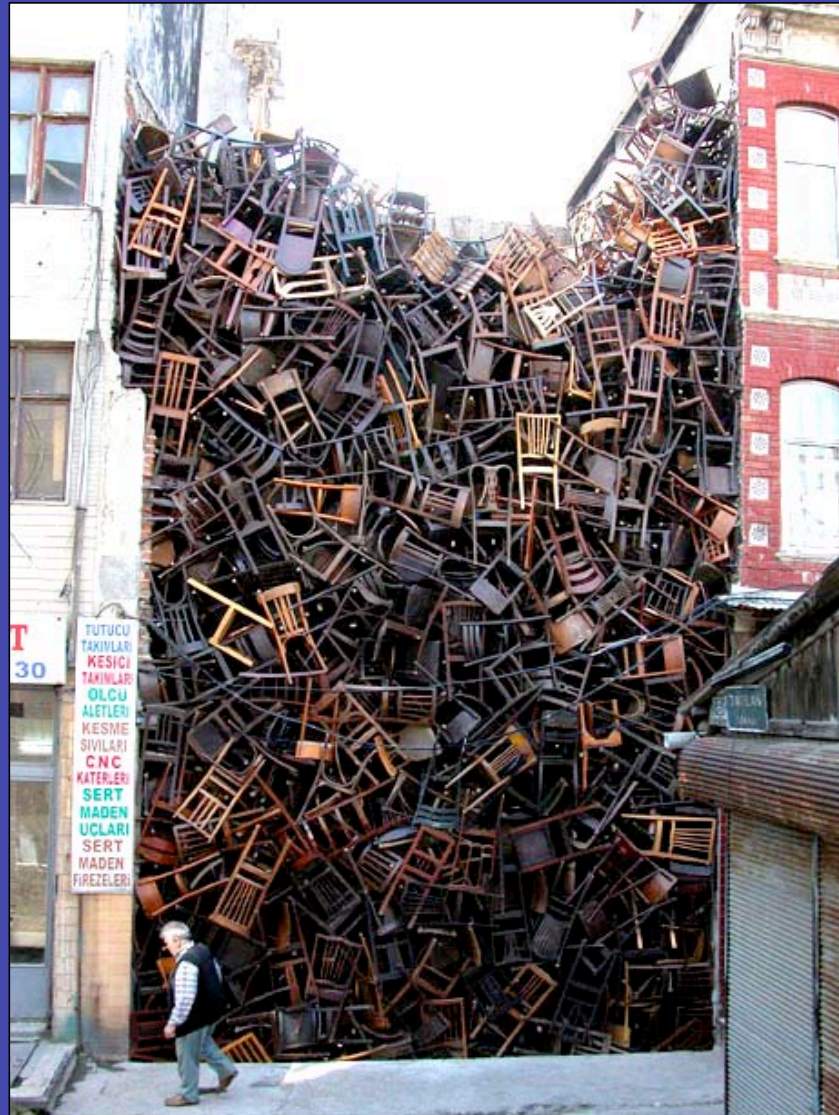
Doris Salcedo Installation for the Istanbul Biennial 2003